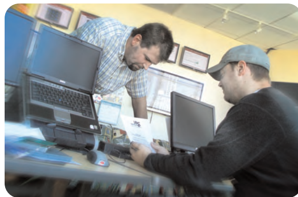
El equipo de LiveSecurity apunta a un tiempo de respuesta de 4 horas.